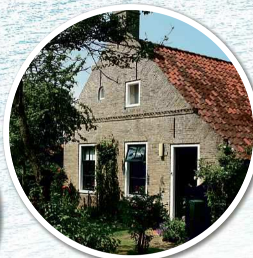
De commandeurshuizen op Ameland zijn te herkennen aan de twee richels met uitstekende steentjes in de voorgevel, zogenaamde muizentandjes.