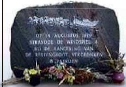
7 Herdenkingssteen op het paardengraf

De ramp van Ameland: op 14 augustus verdronken acht paarden bij de tewaterlating van de reddingsboot. Het paardengraf herinnert aan deze ramp, die toen wereldnieuws was