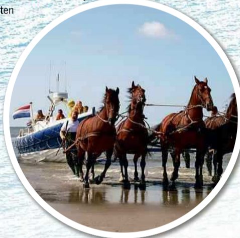
Demonstraties van de paardenreddingboot