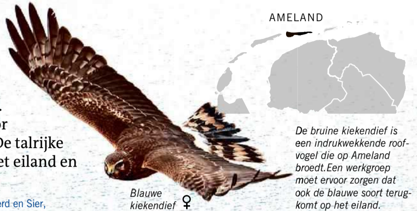
Blauwe kiekendief ♀

Ameland had vroeger nog twee dorpen: Oerd en Sier, die bij stormen in zee zijn verdwenen. De namen leven voort in de boten MS Oerd en de MS Sier, die de veerdienst van en naar de wal verzorgen.